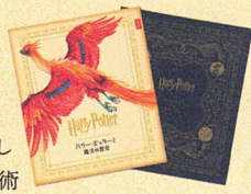
Phoenix illustration by Jim Kay © Bloomsbury Publishing Plc 2016 © & TM Warner Bros. Ent. Publishing Rights © JKR. (s21)